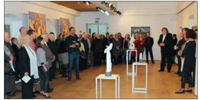
Parodos atidarymas LDS galerijoje „Arka“.