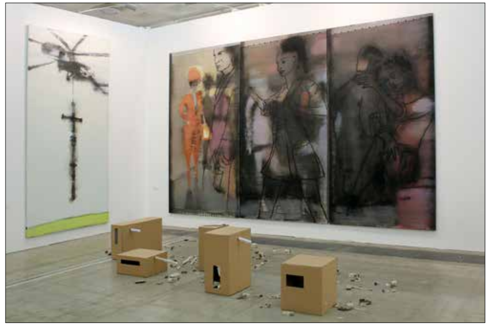
„Meno parko“ stendo fragmentas