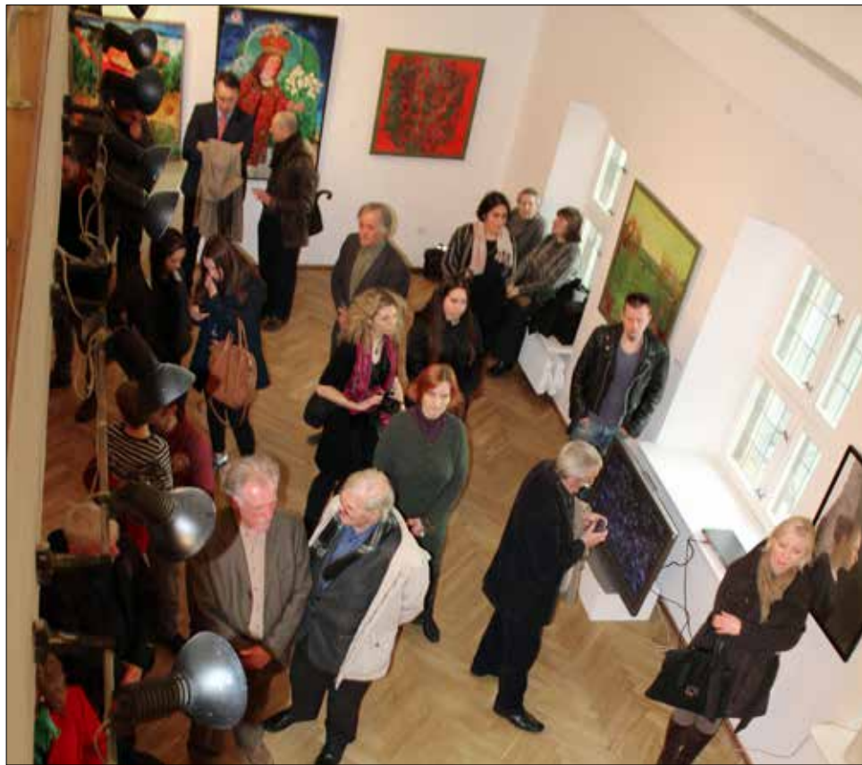
Kasmetinė Vilniaus tapytojų paroda visada sutraukia daug dalyvių ir žiūrovų