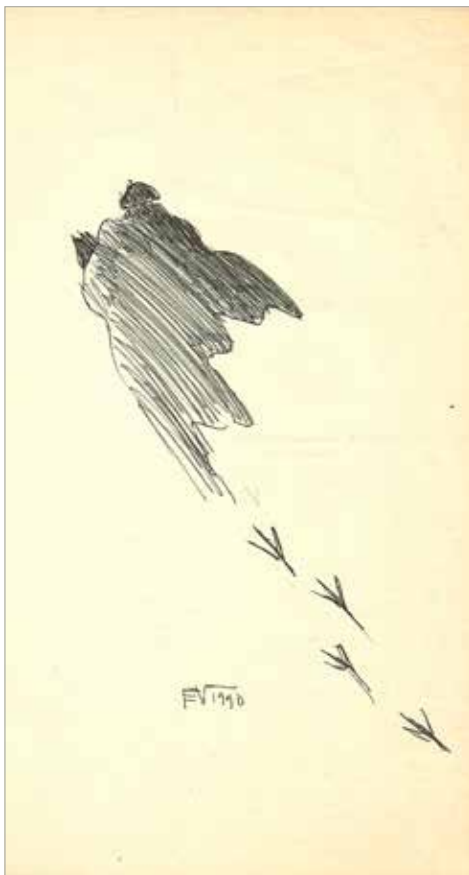
Erikas Varnas, Autošaržas . 1990