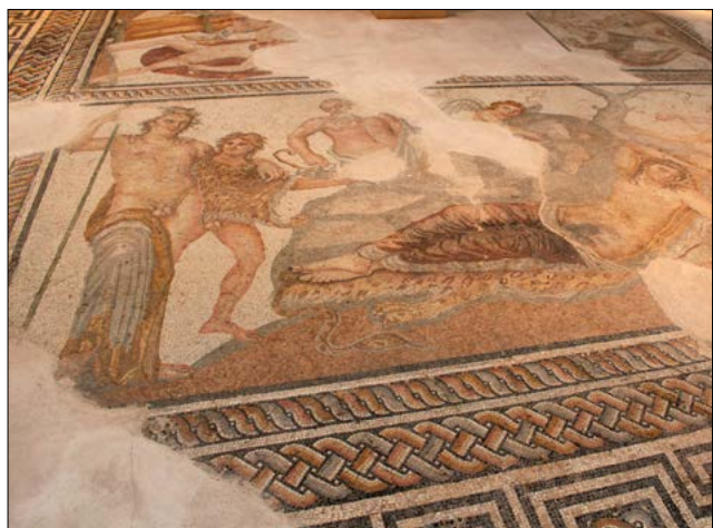
Senovės graikų mozaika

Keliaujant po Europos šalis ir lankant archeologijos muziejus, dėmesį patraukė grindų mozaika „Dionisas su draugais grįžta į Naksą, kur pamato Ariadne“ (200–250, Salonikų archeologijos muziejus, Graikija). Figūrinė kompozicija apsupta ornamentu, kuris buvo populiarus antikinėje Romoje nuo etruskų laikų. Kyla klausimas, kaip okupuotoje Graikijoje (nuo 150 m. pr. Kr.), turint galvoje Romos imperijos elgesį su kitų tikėjimų atstovais (pvz., krikščionimis), galėjo rūpėti kitos tautos dievai? Sunku suprasti, ar čia vaizduojamas jaunas vyras su vainiku, panašiu į ažuolo lapų vainiką, tikrai vynu dievas Dionisas. Fone matomas ažuolas be lapų taip pat liudija, kad kalbama ne apie graikų, o apie romėnų dievus. Ženkli aplink figūrinę kompoziciją baltų kultūroje simbolizuoja Perkūną, Saulės dievą ir Žemę Motiną. Tada grindų mozaikos temą būtų galima aiškinti kitaip: ažuolas be lapų simbolizuoja žiemą. Žemė Motina žiemą miega. Žiemą ateina Naujieji metai, naujas Saulės dievas Janas. Senasis Saulės dievas su balta barzda su mumis atsiveikia (Kalėdos). Perkūnas yra miškų ir gyvūnų valdovas, pasitinka ir palydi naująjį dievą – jaunąjį Janą. Angelas su vandens paukščio sparnais būtų atitinkamo etruskų anties simboliui, kuris yra tarpininkas tarp žmonių ir dievų.