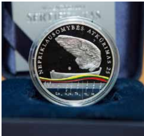
Trispalvė jubiliejinė moneta