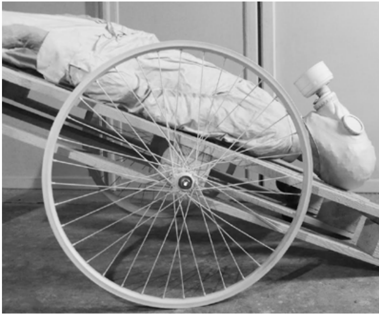
Metaforiški Dainiaus Trumpio langai, orientuoti į žiūrovo jausmus