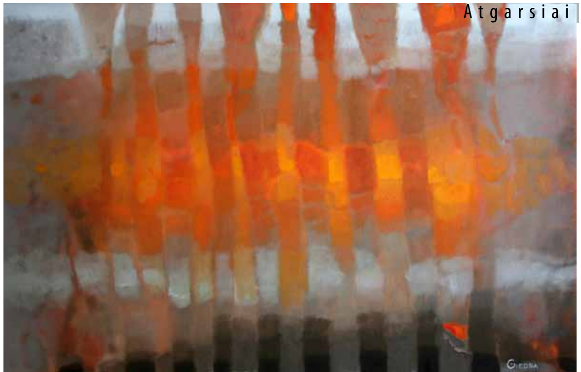
G.Purlytė „Ugnis ir ledas“