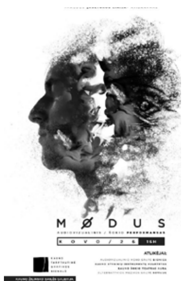
Plakato autorius – grupė „Bionics“

Kūrinio autoriai – audiovizualinio meno grupė „Bionics“, Kauno styginių instrumentų kvartetas, šokio teatras „Aura“, alternatyvios muzikos grupė „Sovijus“.