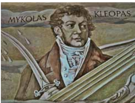
M.K Oginskis buvo kūrėjas ir kovotojas

Perfrazuojant Mykolo Kleopo žodžius apie piliečių priedermę savo tautai, valstybei, iš esmės aktualumas neprarandamas ir šiandien: kiekvienas pilietis, jo tokia pareiga, privalo stengtis ir ieškoti būdų, jog būtų atgaivinta Lietuvos gerovė, atnešanti tikrą ir neabejotiną naudą tautai, valstybei ir joje gyvenantiems.