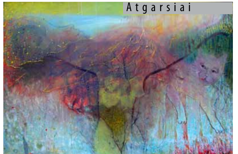
Lina Beržanskytė-Trembo, „Mano erdvė II“, 2015 m.