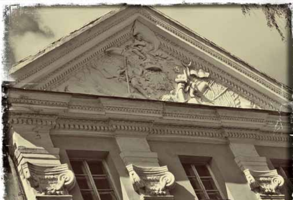
Sluškų rūmai Vilniuje. Juose 1794 m. buvo įsikūrusi vadavietė. Iš čia T.Kosciuškos sukilimui Lietuvoje vadovavo M. K. Oginskis.