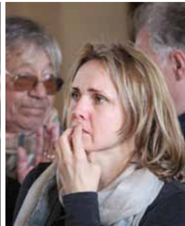
Konferencijoje užfiksuoti vaizdai iškalbingesni už bet kokius žodžius. Visas fotoreportažas iš karto po konferencijos buvo patalpintas Lietuvos dailininkų sąjungos Facebook'e (veidaknygėje).