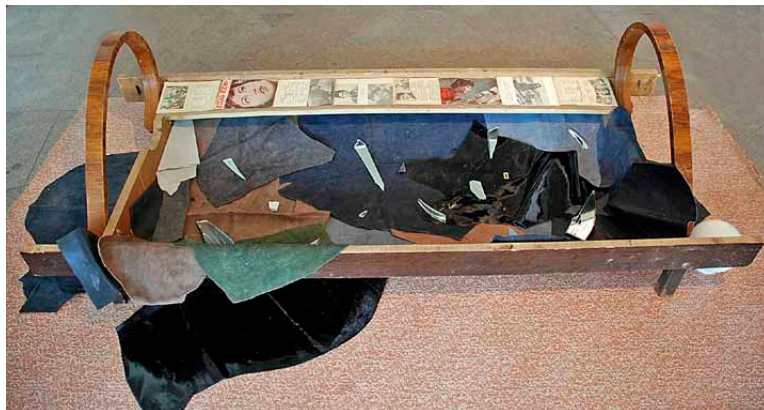
P. Ramanausko bandymas iš padrikų objektų kurti vizualią visumą liudija postmodernų požiūrį į kūrybą.

Eksponuojami ir su kūryba, ir su kasdienybe susiję objektai: paveikslų rėmai, sudužę veidrodžiai, apšviesti lempų, sovietmetį menantys daiktai, Kauno buities namų studijos durys („Buitis“), iškarpos iš sovietmečio laikraščių. Tai – savo vertę jau praradę „relikvai“ iš Kauno buities namų studijos, o jų eksponavimas kuriant instaliacijas – nelyg bandymas atgaivinti mirusią praeitį (Kauno buities namai nebeveikia). Ta praeitis – kažkuo skaudi, žei-