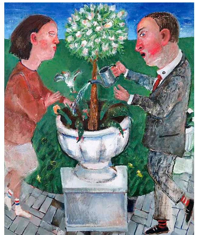
Aleksandras Vozbinas. „Kurortinis romanas“.