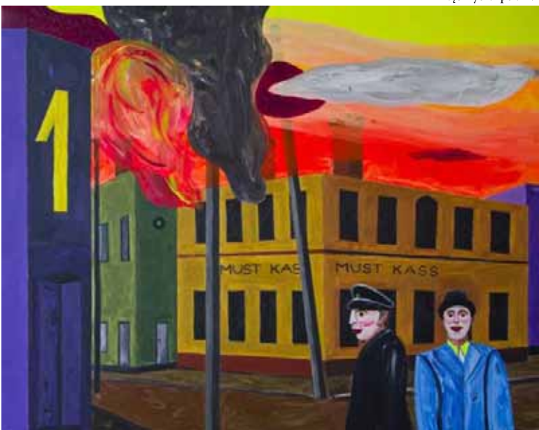
← pradžia 1 psl.